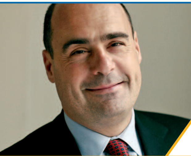
Presidente Regione Lazio