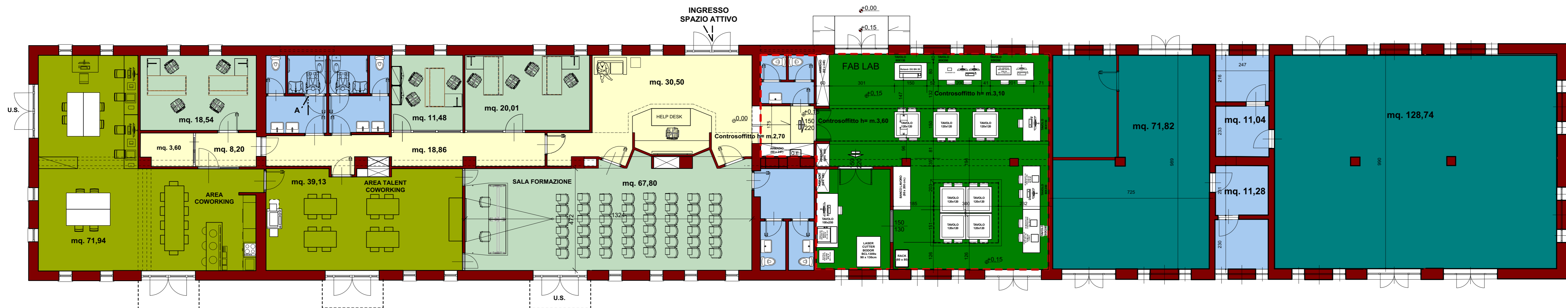
PLANIMETRIA PIANO TERRA - EDIFICIO A